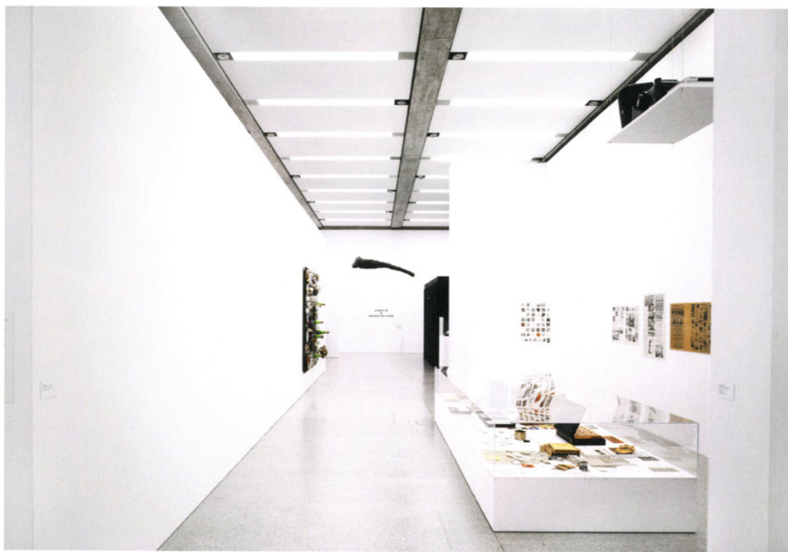
Candida Höfer, Museum Moderner Kunst Stiftung Ludwig Wien VII 2007

Farbfotografie | color photograph 58 x 71,5 cm