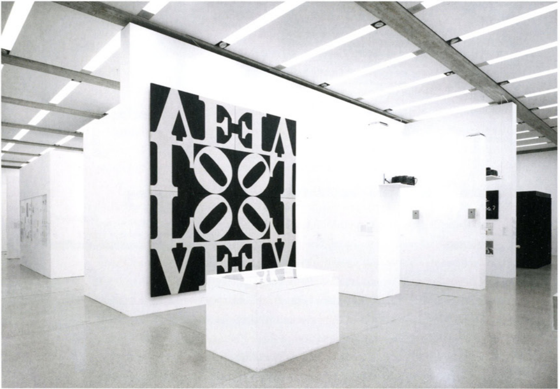
Candida Höfer, Museum Moderner Kunst Stiftung Ludwig Wien V 2007

Farbfotografie | color photograph 58 x 71,5 cm