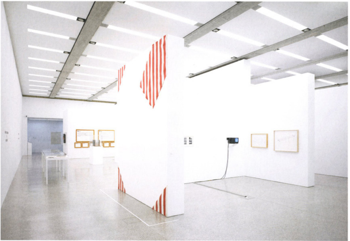
Candida Höfer, Museum Moderner Kunst Stiftung Ludwig Wien VI 2007 Farbfotografie | color photograph 58 x 71,5 cm Museum Moderner Kunst Stiftung Ludwig Wien Erworben | aquired in 2007