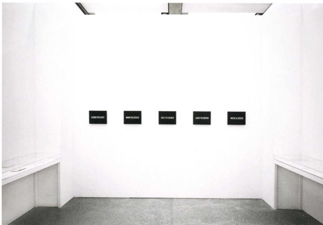
Candida Höfer, Museum Moderner Kunst Stiftung Ludwig Wien VIII 2007 Farbfotografie | color photograph 58 x 71,5 cm Museum Moderner Kunst Stiftung Ludwig Wien Erworben | aquired 2007 © Candida Höfer, Köln