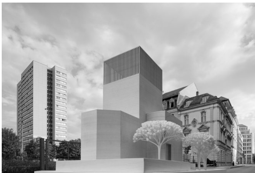
1 House of One, Berlin, Entwurf Kuehn Malvezzi, Collage

kontinuierlichen Auseinandersetzung der drei religiösen Partner um das Thema, wie theologische Fragestellungen und Thesen in dieser Konstellation und Zielsetzung konkret im Raum Ausdruck finden.